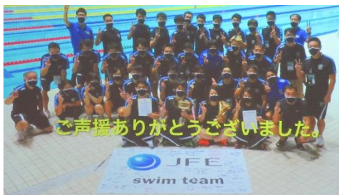
〔映像の最後に水泳部からメッセージ〕