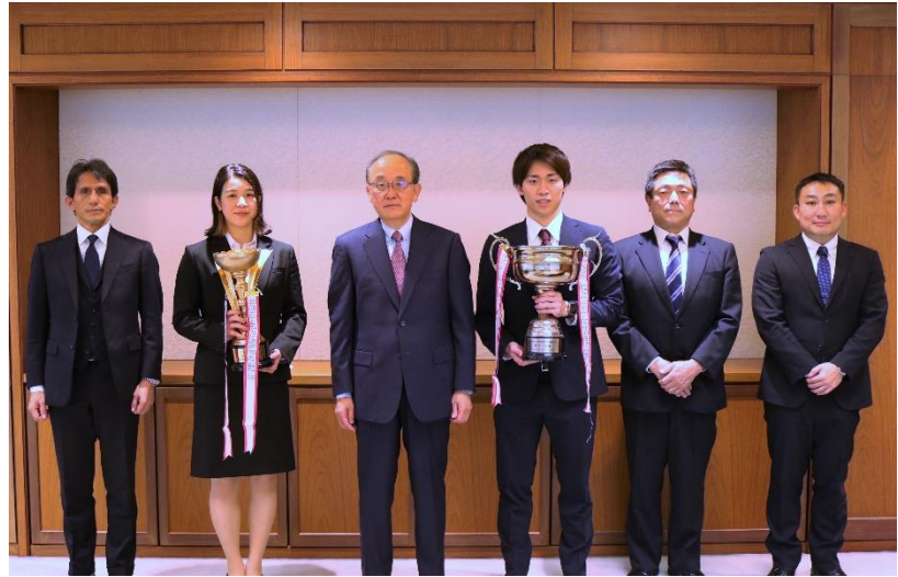
古米後援会長 森女子主将 柿木社長 渡会男子主将 小倉監督 川人部長