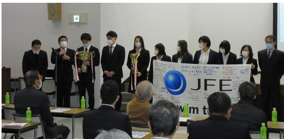
〔優勝カップと応援旗を手に入場整列〕